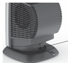
כבל חיבור לחשמל